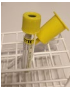
6 ml vakuumsrør til Medisinsk biokjemi og blodbank

Merk at 6 ml-røra berre skal brukast til urinprøver til biokjemiske analyser ved laboratoria i Helse Møre og Romsdal. Prøver til mikrobiologi og cytologi sendast på andre behaldarar som oppgitt nedanfor.