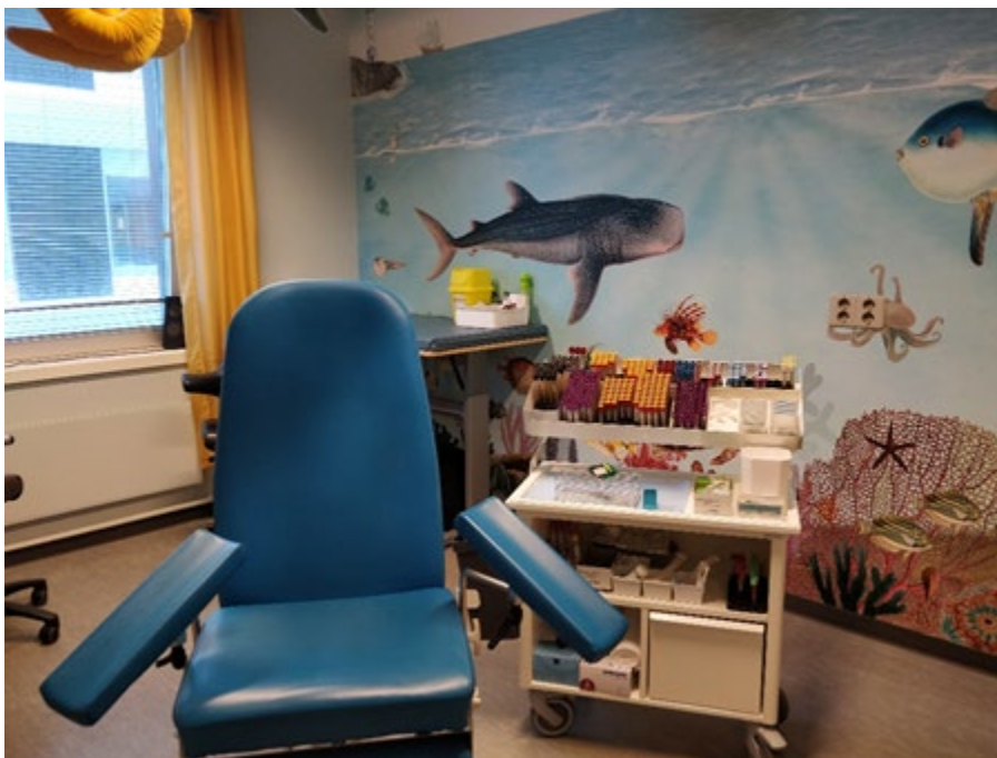
Eitt av dei nyoppussa romma ved prøvetakingspoliklinikken ved Medisinsk biokjemi og blodbank, Ålesund. Dette er spesielt tilpassa for barn som skal ta blodprøver.

Vi veit at mange pasientar og rekvirentar set pris på dette tilbudet, og er glade for at vi kan tilby prøvetaking på kveldstid.