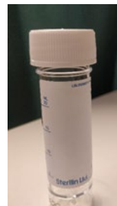
20 ml universalcontainer til patologi (tilsett 50% etanol, halvt om halvt med prøvemengde)