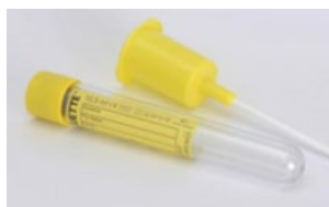
10,5 ml CCM-rør til mikrobiologi